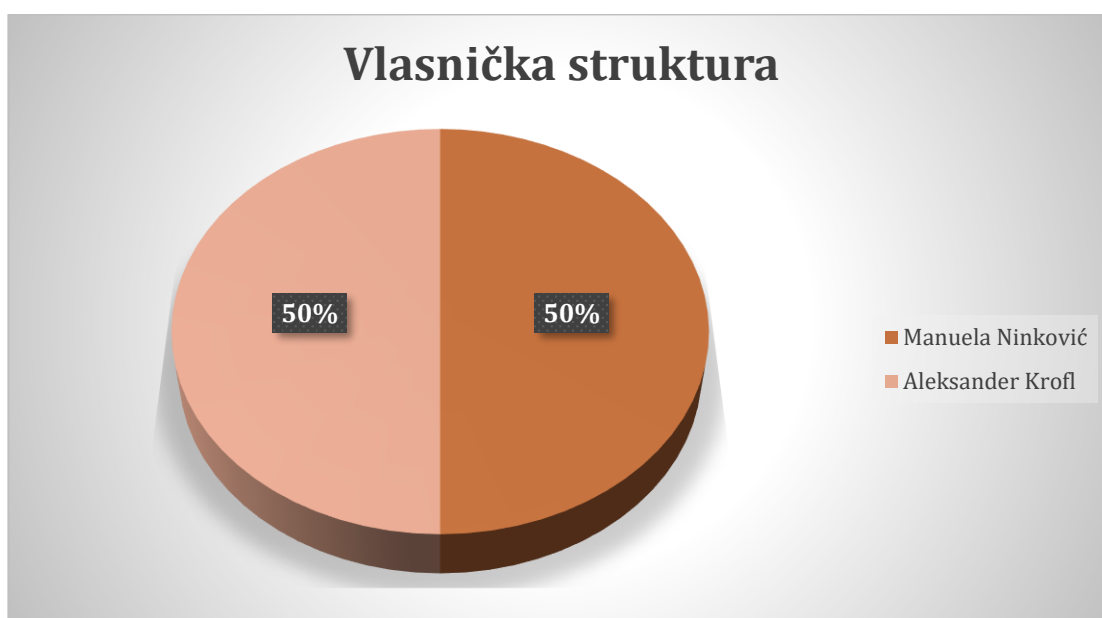
Grafički prikaz: Vlasnička struktura